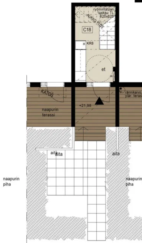
1. KERROS SISÄÄNTULO