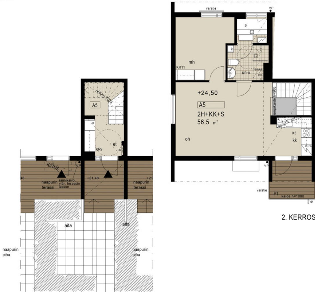
1. KERROS SISÄÄNTULO