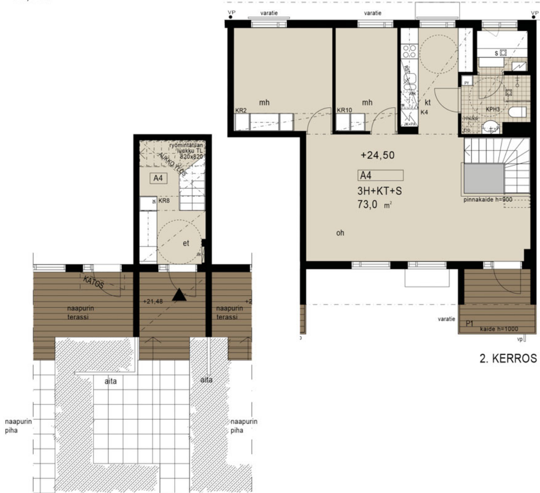
1. KERROS SISÄÄNTULO