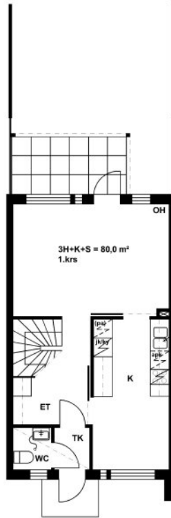
Pellonkulmantie 12 C 24 / Pohjakuva Ei mittakaavassa