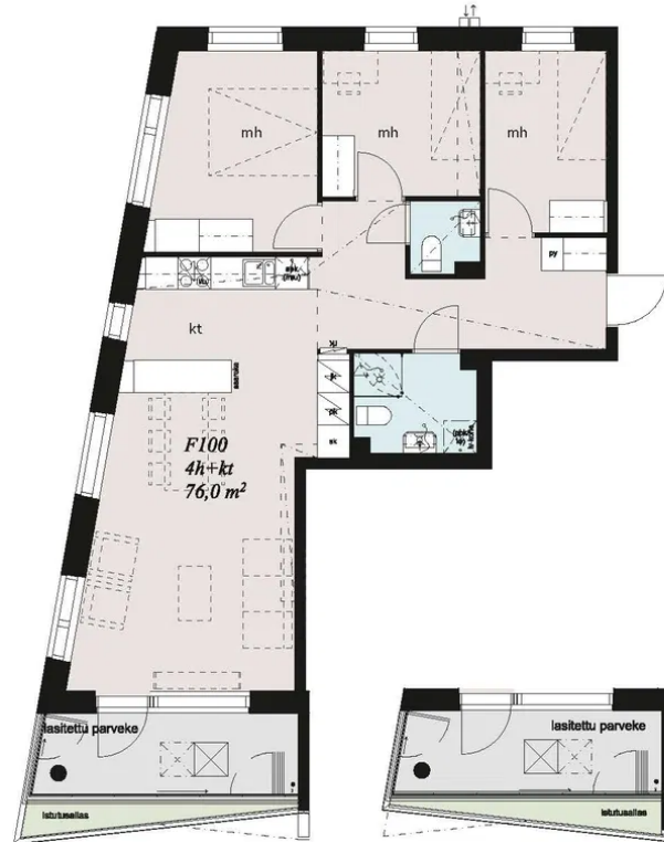
Parvekkeet F100, F110